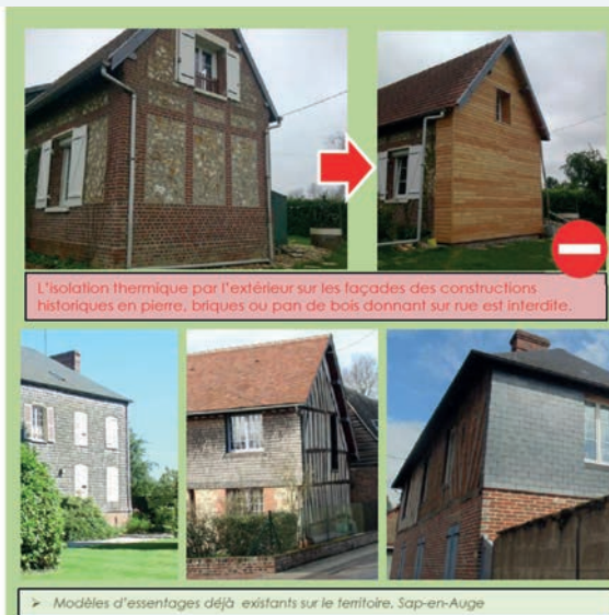
L'isolation thermique par l'extérieur sur les façades des constructions historiques en pierre, briques ou pan de bois donnant sur rue est interdite.