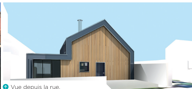
↑ Vue depuis la rue.