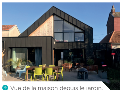
↑ Vue de la maison depuis le jardin.

A l'intérieur, le béton brut et les planchers métalliques donnent un côté authentique aux espaces de vie. A l'extérieur, l'isolant est revêtu de deux matériaux : un bardage en clin de mélèze en pose verticale et un zinc à joints debout anthracite.