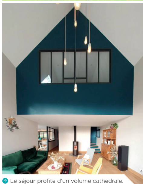
↑ Le séjour profite d'un volume cathédrale.