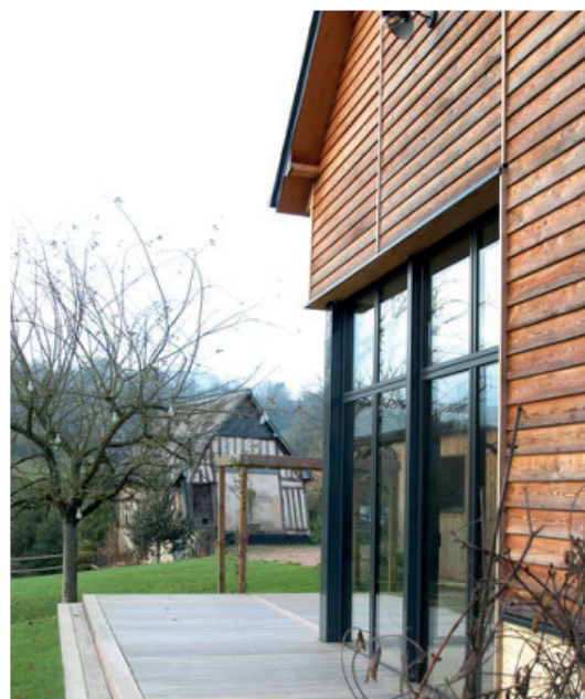
↑ Bardage clin à recouvrement rythmé verticalement.