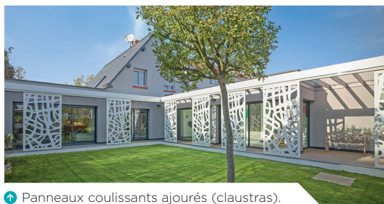
➊ Panneaux coulissants ajourés (claustras).

Le clin bois apporte un aspect chaleureux au pignon. Côté jardin, des éléments coulissants ont été intégrés à la façade afin de créer des brise-soleil, mais aussi des brise-vues.