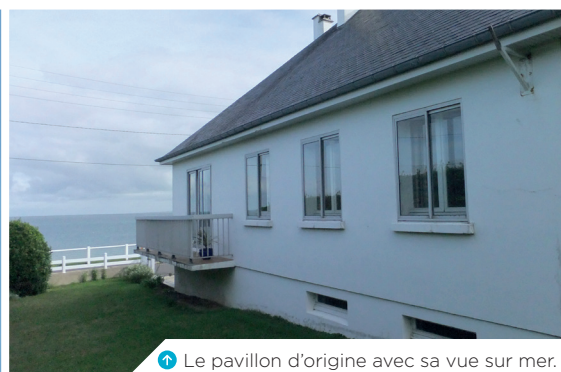
2 Le pavillon d'origine avec sa vue sur mer.