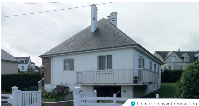
➔ La maison avant rénovation

Les façades ont été isolées par l'extérieur. Le bardage sombre des pointes de pignons et les deux fenêtres devenues de grands carrés participent à créer une nouvelle géométrie qui gomme la banalité architecturale du pavillon d'origine. La démolition du balcon a permis la construction d'une large terrasse à l'ouest, créant un nouveau rapport au jardin.