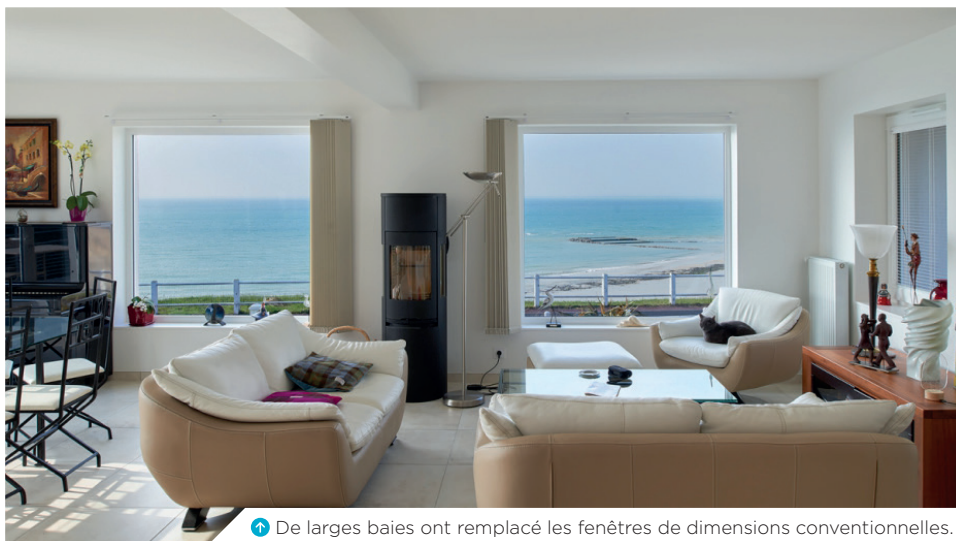
5 De larges baies ont remplacé les fenêtres de dimensions conventionnelles.