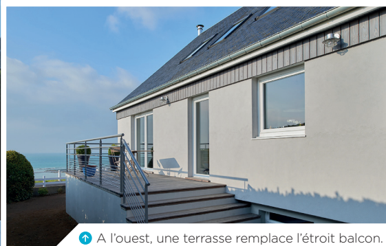
3 A l'ouest, une terrasse remplace l'étroit balcon.