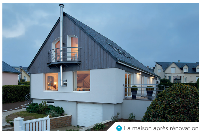
➔ La maison après rénovation