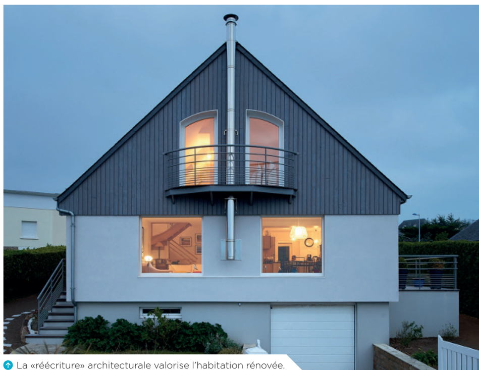
1 La «réécriture» architecturale valorise l'habitation rénovée.

Les logements des années 1970 sont particulièrement énergivores car ils ont été construits sans préoccupation énergétique. Le manque d'isolation était compensé par la généralisation du chauffage central.