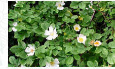
Eglantier commun (rosier) Rosa canina