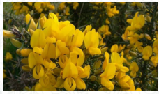
Ajonc d'Europe Ulex europaeus