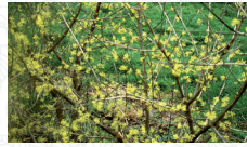
Cornouiller mâle Cornus mas