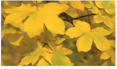
Erable champêtre Acer campestre