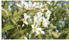
Amélanchier vulgaire Amelanchier ovalis