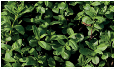
Buis commun Buxus sempervirens