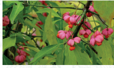
Fusain d'Europe Euonymus europaeus