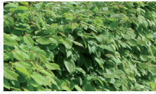
Charme commun Carpinus betulus