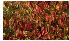
Cornouiller sanguin Cornus sanguinea