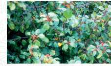
Bourdaine Rhamnus frangula