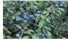
Prunellier Prunus spinosa

Choisir des variétés résistantes à la graphiose