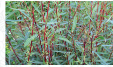
Sauge/Osier pourpre Salix purpurea