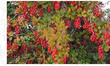
Epine vinette Berberis vulgaris