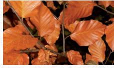
Hêtre commun Fagus sylvatica