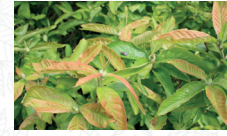
Néflier commun Mespilus germanica