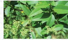
Troène commun Ligustrum vulgare