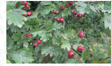
Aubépine épineuse Crataegus laevigata