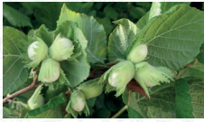
Noisetier/Coudrier Corylus avellana