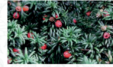
If Taxus baccata