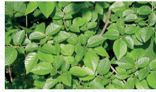
Orme champêtre Ulmus minor