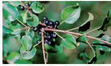
Nerprun purgatif Rhamnus catharticus