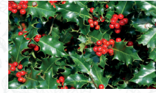
Houx commun Ilex aquifolium