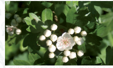
Aubépine monogyne Crataegus monogyna